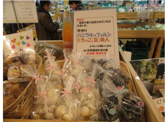
整然と並んだバナラキッフェルンとくろっこ美人

去年の9月に加工施設「キッチンほたる」が完成してから5か月、念願の京丹波の道の駅「味夢の里」に出店することが出来ました。洋菓子「バナラキッフェルン」と京丹波の黒大豆を生かした「くろっこ(豆)美人」です。バナラキッフェルンはバターの上品な味と甘みに仕上げ、くろっこ(豆)美人は、京丹波特産黒大豆の風味を生かした香ばしい味に仕上げました。