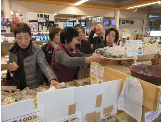
商品を並べるほたるの里女性部「夢ほたる」メンバー